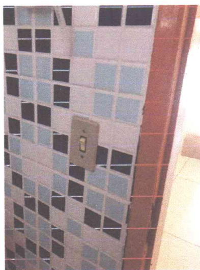
Figura 9: Interruptor de banheiro

- TROCA DE INTERRUPTORES E TOMADAS PARA PADRÃO ATUAL, ALÉM DE REVISÃO NA INSTALAÇÃO