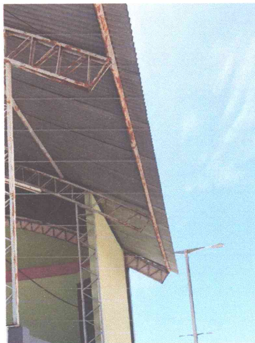
Figura 16: Talhado do palco