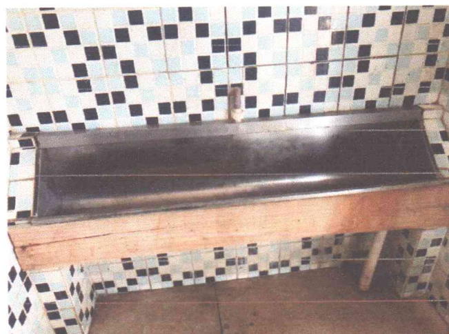
Figura 3: Mictório danificado com tábua de madeira improvisada