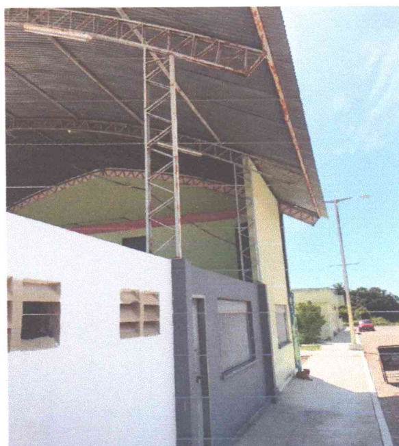
Figura 13: Perfil metálico da cobertura