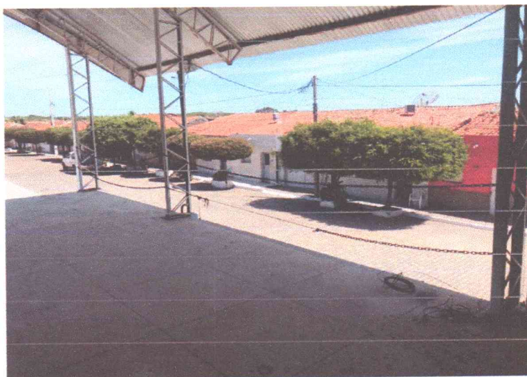
Figura 17: Palco sem corrimão nas laterais