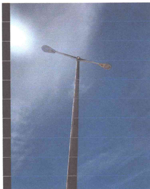
Figura 12: Substituição de lâmpadas públicas para lâmpadas de LED de até 97W