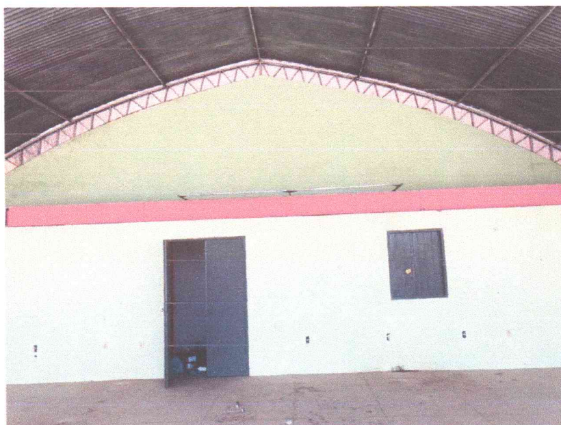
Figura 15: Parte interna do prédio

- PINTURA EM TODO O PRÉDIO DA PRAÇA Figura 14: Palco da praça do município