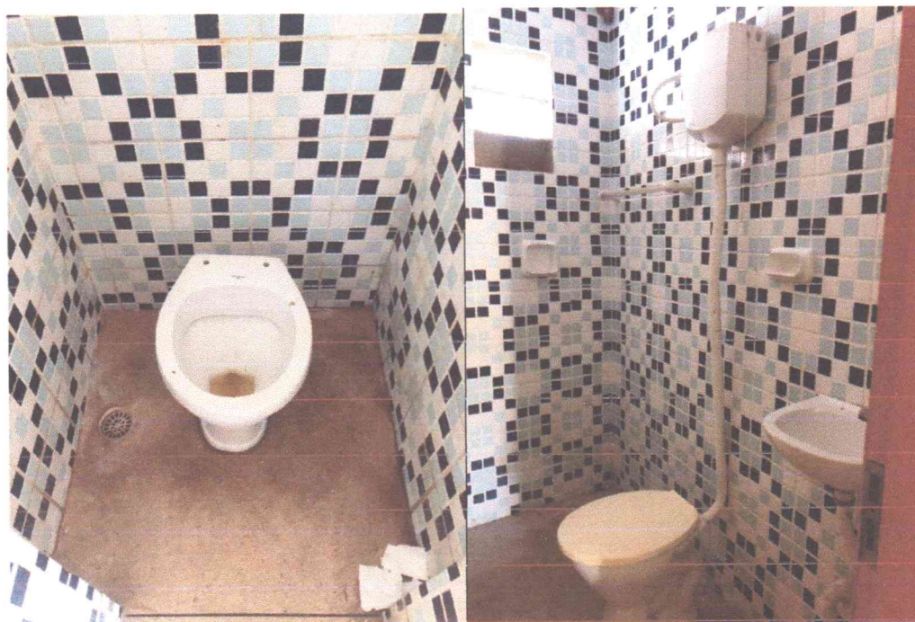
Figura 1 e Figura 2: Banheiros com vasos sanitários, lavatórios danificados e sem utensílios de WC